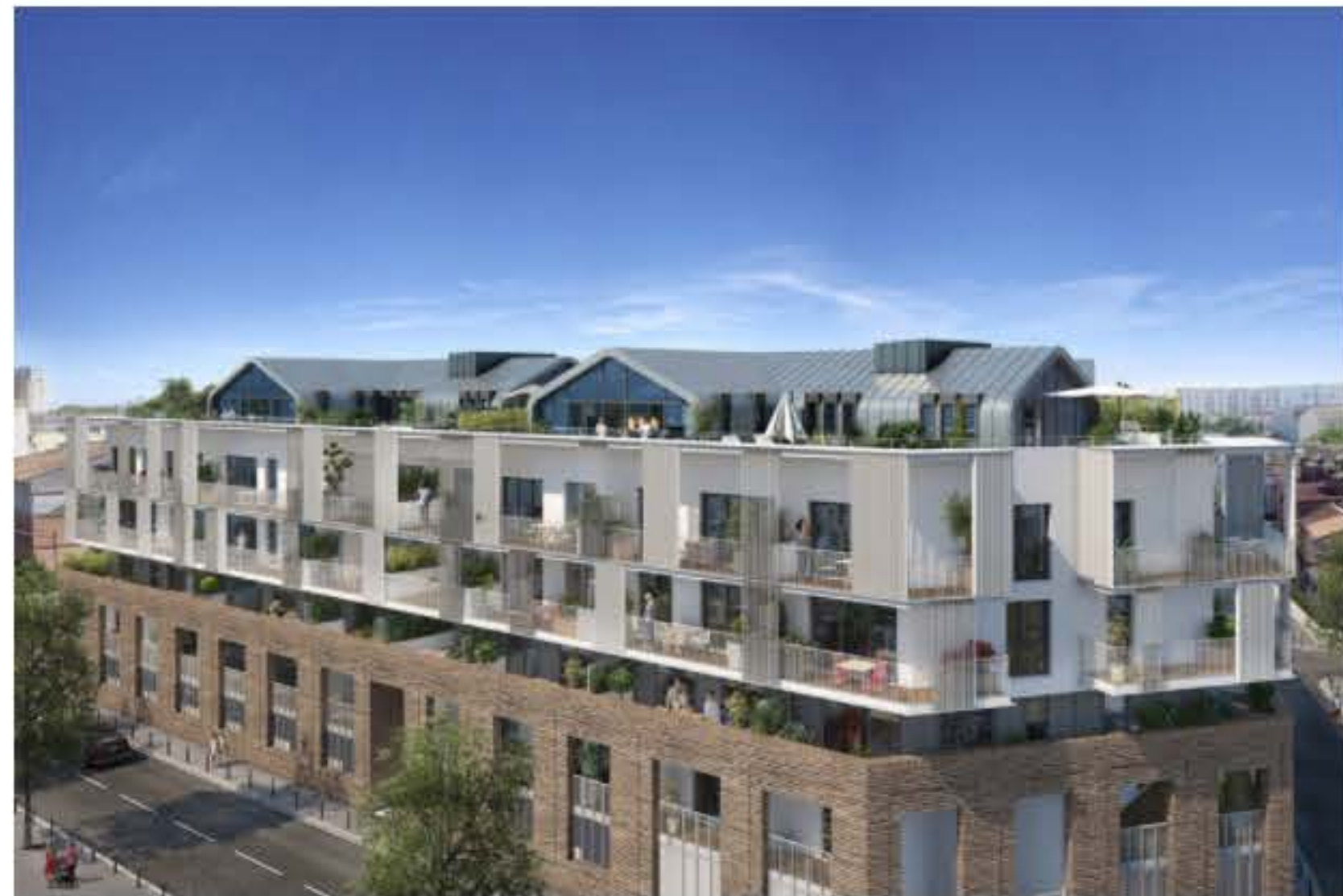
La résidence offrira beaucoup de balcons et terrasses. (©Fonta/Letellier Architectes)

Côté architecture , (qu'on doit à Axel Letellier de Letellier Architectes ), la base sera en brique, mais il y aura aussi de l'aluminium. Et surtout, des maisons de toit . Maisons qui disposeront de terrasses avec des vues exceptionnelles sur la Garonne et sur le centre de Toulouse (relié ici à Saint-Cyprien par le Pont des Catalans).