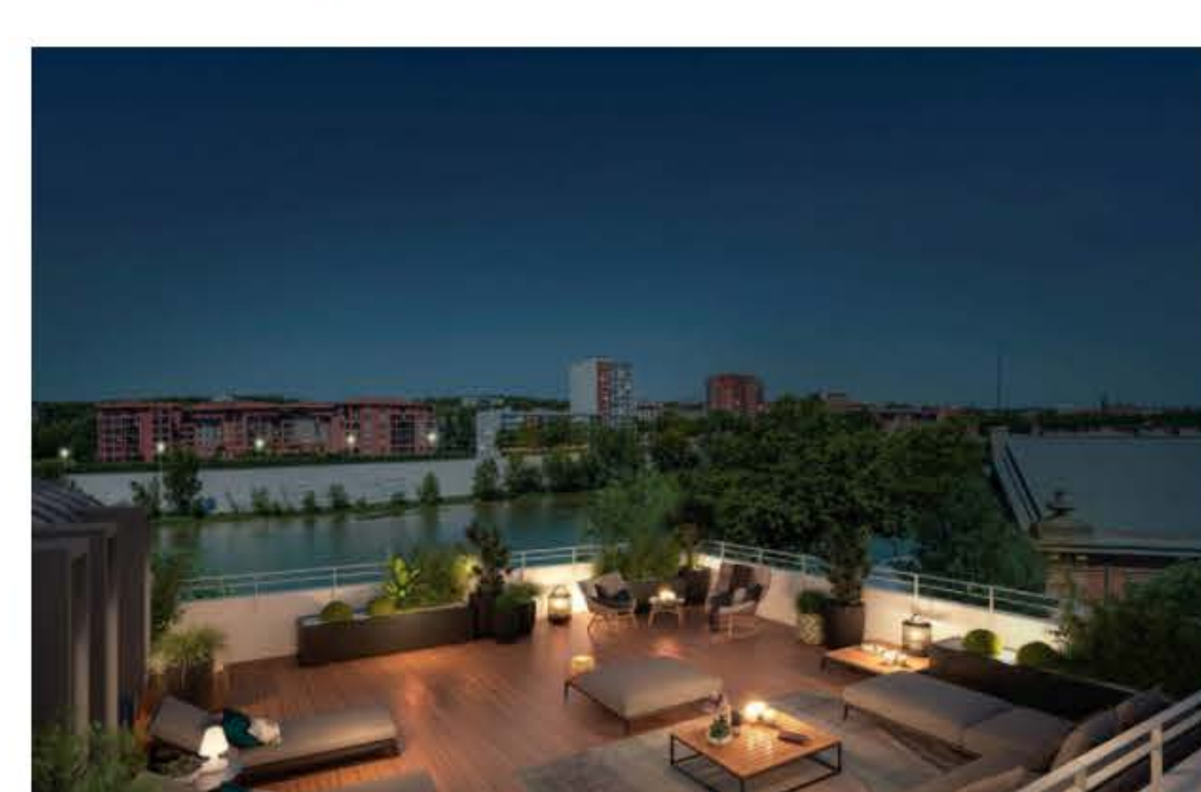
La terrasse de nuit. (©Fonta/Letellier Architectes)

Bien sûr tout ceci a un coût. Pour les studios, le ticket d'entrée est à 202 000 euros. Pour les deux pièces, il oscille entre 255 000 et 315 000 euros. Côté T3, les prix se situent entre 383 000 et 446 000 euros . Certains T4 seront moins chers, dès 276 000 euros. D'autres plus, jusqu'à 590 000 euros. Pour les T5, il faudra passer le seuil symbolique du million (1 150 000 euros). Enfin, pour acquérir le T6 il faudra déboursier 1 350 000 euros.