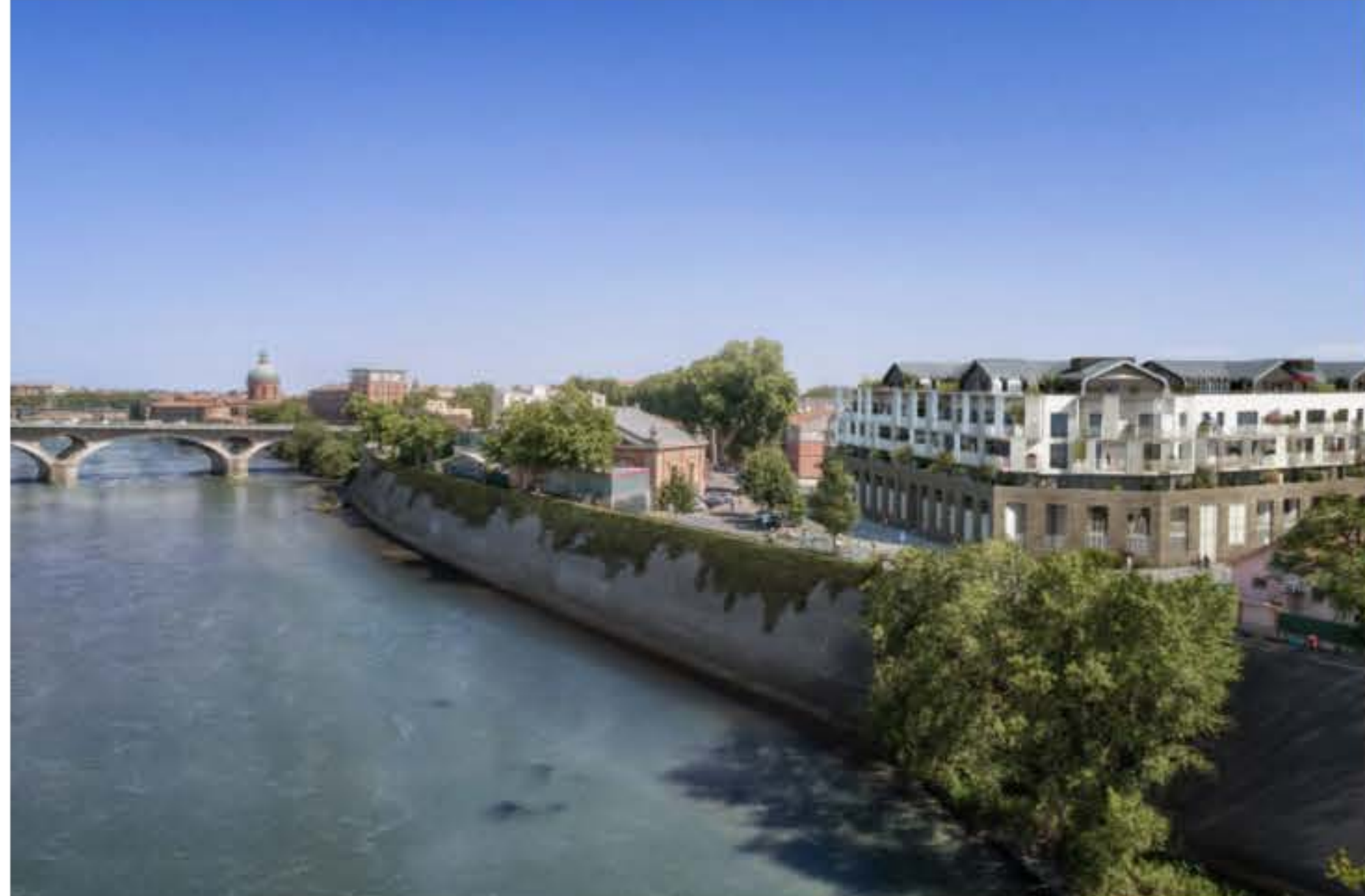
La résidence sera au bord de la Garonne. (©Fonta/Letellier Architectes)

La résidence "Les Belles Rives", dans le quartier Saint-Cyprien à Toulouse, proposera des grandes terrasses et des baies vitrées avec vues sur la Garonne en 2024.