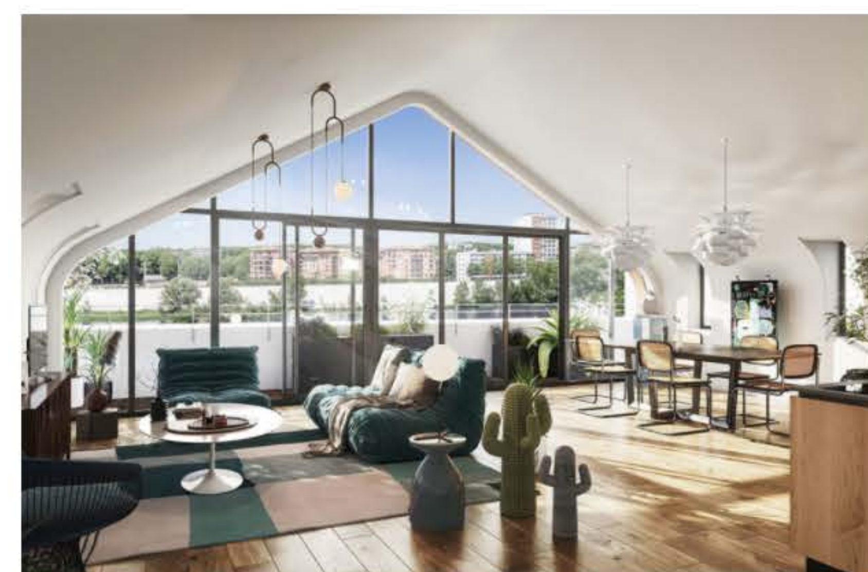
Une grande baie vitrée de maison de toit.

Côté dimensions, il y en a pour tous les besoins. Et même les petits appartements offrent quelques avantages parfois réservés aux plus grands, comme des loggias, des jardins d'hiver ou des terrasses dès les T2, quand ce n'est pas plusieurs à la fois et en duplex. Pour les T3, ce seront par exemple des balcons de la taille d'une chambre (14 m 2 ). Des T4 proposeront même des terrasses aussi grandes qu'un appartement (33 m 2 ) .